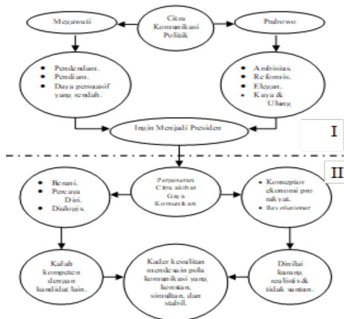
Pada Bagian I pola komunikasi kader lebih bersifat statis. Pada Bagian II pola komunikasi kader sangat dinamis.

Bagan di bawah ini menunjukkan bagaimana batasan era itu dapat dibagi dalam dua daerah yang hirarkis, seperti sebuah kondisi kemudahan dan keoptimisan yang kemudian berubah menjadi sebuah tantangan. Dinamika ini dapat dilihat lebih dikarenakan sebagai kelemahan sistem partai massa yang lebih mengandalkan figur sentral dan kurang adanya faktor inspiratif dan aspiratif. Apa yang dikehendaki secara individu oleh pimpinan seakan-akan tidak lagi dapat dianulir atau direduksi, kader hanya menindaklanjuti.