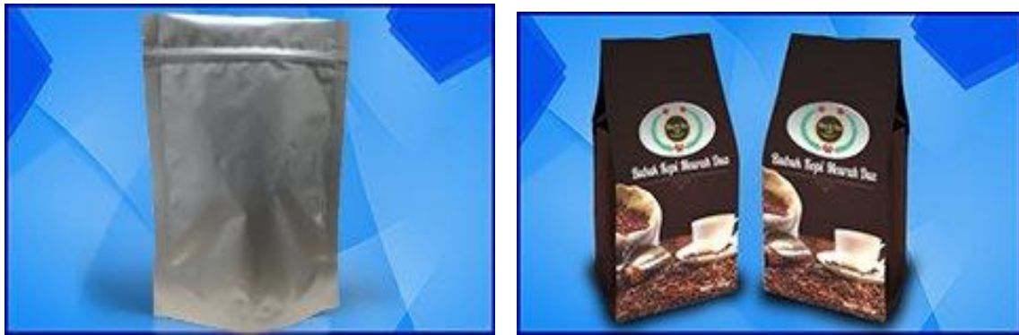
Gambar 1. Kemasan Aluminium

Pada kegiatan ini peserta yang mengikuti penyuluhan meliputi para santri, ustad/ustadzah, Evaluasi kegiatan pengabdian kepada masyarakat dilakukan dengan memberikan kuesioner melalui google form https://bit.ly/kuisisioner . Kuisisioner berisi sepuluh pertanyaan (Tabel 3) untuk mengetahui sejauh mana materi yang telah diberikan dapat dipahami oleh peserta setelah mendapat penyuluhan.