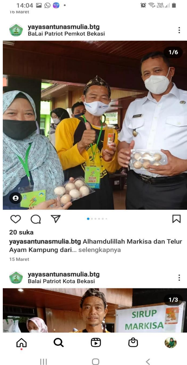
Gambar 7 Pemasaran Melalui Pameran Langsung