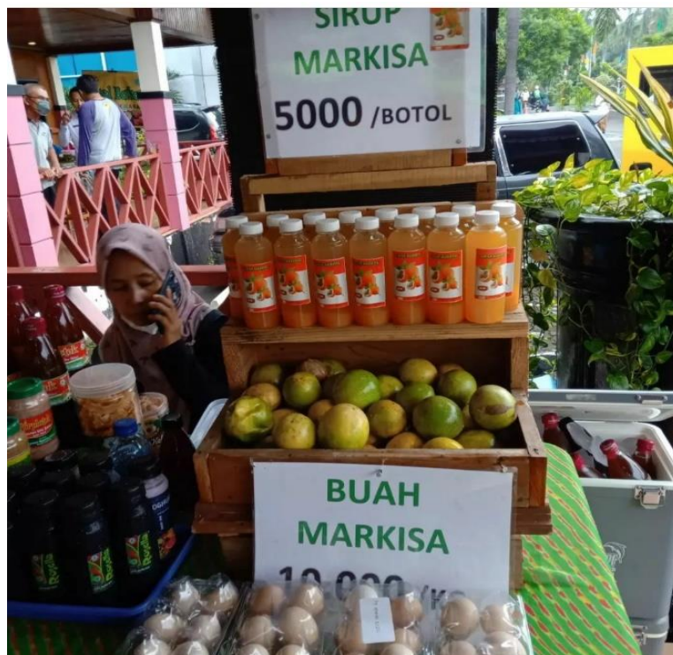
Gambar 3. Kemasan Botol Produk Sirup Markisa

Tampilan dari produk Sirup Markisa masih sederhana. Botol plastik dengan ditempel label bertuliskan Sirup Markisa dan gambar buah Markisa. Dengan harga yang terjangkau.