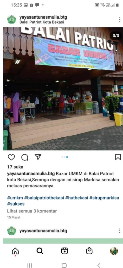
Gambar 4 Pemasaran Produk Melalui Pameran