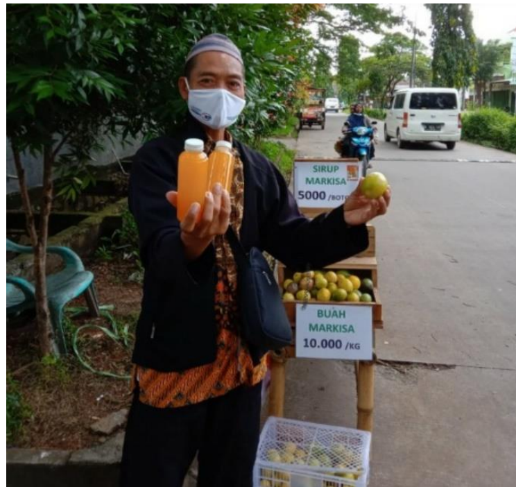
Gambar 1. Produk Sirup Markisa dalam kemasan botol