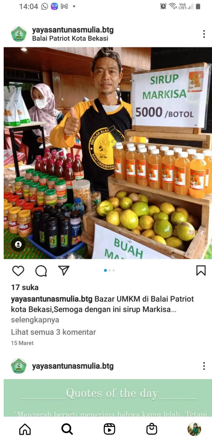
Gambar 5 Pemasaran Produk Melalui Instagram