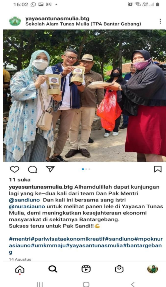
Gambar 6 Kunjungan Menteri Pariwisata

Selain bekerjasama dengan MNC Peduli, Yayasan Tunas Alam juga mendapat dukungan dari beberapa Perguruan Tinggi, seperti Universitas Jayabaya Jakarta. Bahkan juga mendapat dukungan dari pengusaha Sandiaga Uno.