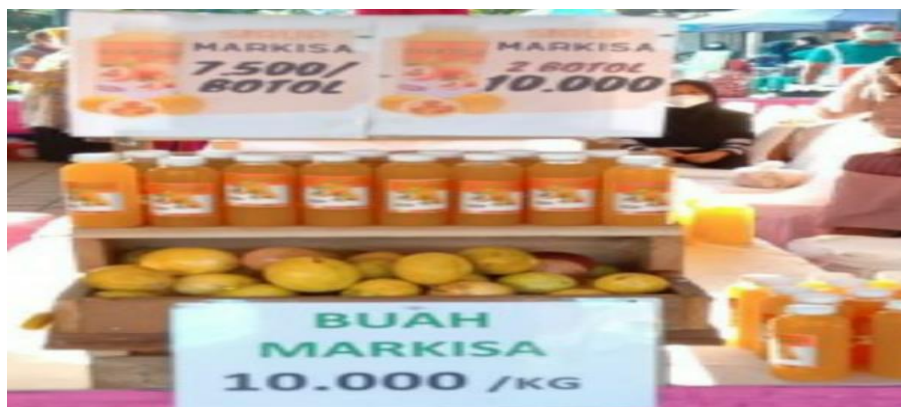
Gambar 2 Produk Sirup Markisa dan Buah Markisa