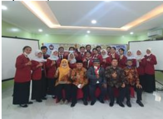
Gambar 4: Narasumber dan Peserta Workshop

Dari post test yang dilakukan setelah berakhirnya acara paparan, rata-rata peserta memahami akan pembuatan media promosi melalui instagram dan lainnya, artinya mereka mampu membuat sebuah media instagram untuk mempromosikan produk-produk yang mereka hasilkan. Dari kegiatan workshop ini diharapkan peserta dapat mengembangkannya, selanjutnya dapat menularkan ilmunya kepada calon-calon pengusaha dan terciptanya social preneur.