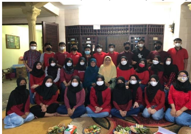
Gambar 3: Peserta Workshop Inovasi Pemasaran dan Socio Preneur

Promosi secara getok tular atau word of mouth (WOM) akan terjadi dan hal tersebut tergantung kepada produk yang di tawarkan apakah memuaskan atau mengecewakan. Promosi WOM ini merupakan promosi yang sangat ampuh dan efektif.