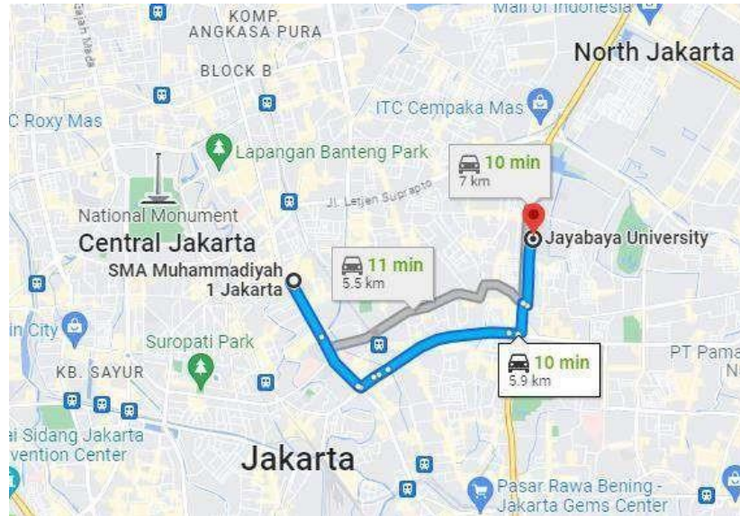
.Gambar 1. Lokasi SMA Muhammadiyah 1 Jakarta

Kegiatan pengabdian kepada masyarakat dilakukan di sekolah SMA Muhammadiyah I Jakarta dengan alamat Jl.Kramat Raya No.49, RT.3/RW.4, Kramat, Kec. Senen, Kota Jakarta Pusat, Daerah Khusus Ibukota Jakarta 10450